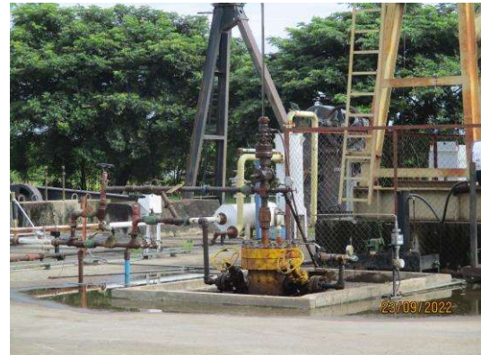
พื้นที่ฐานหลุมผลิต L33-8