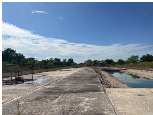
รูปที่ 1-2 สภาพของพื้นที่ฐานหลุมผลิต ในระยะผลิตปิโตรเลียม