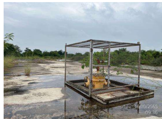
พื้นที่ฐานหลุมผลิต WBW-10