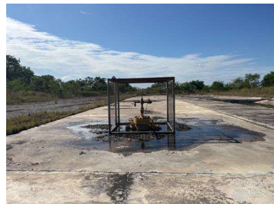
พื้นที่ฐานหลุมผลิต WBW-1